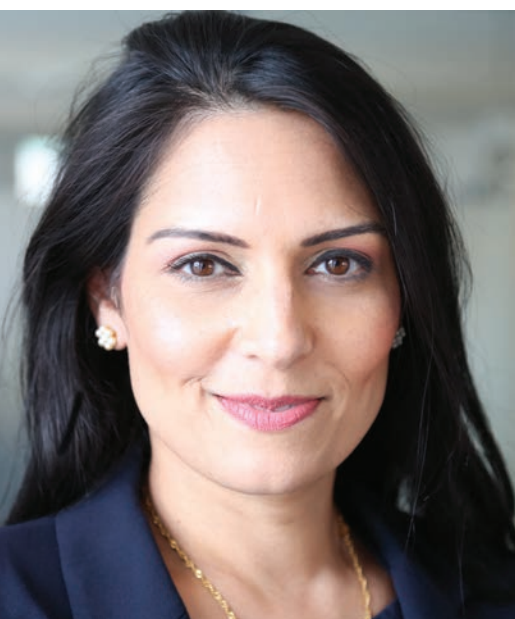
Le très honorable Jeremy Hunt, Député Ministre de la Santé

Le Dr David Nabarro est le parfait candidat pour le poste de Directeur général de l'Organisation mondiale de la Santé. Grâce à son expérience et à son long parcours, le Dr Nabarro apportera un leadership solide et sera soucieux de poursuivre les réformes dont l'OMS a besoin et qu'attendent les États membres, pour améliorer la santé et accroître la prospérité des populations les plus démunies.